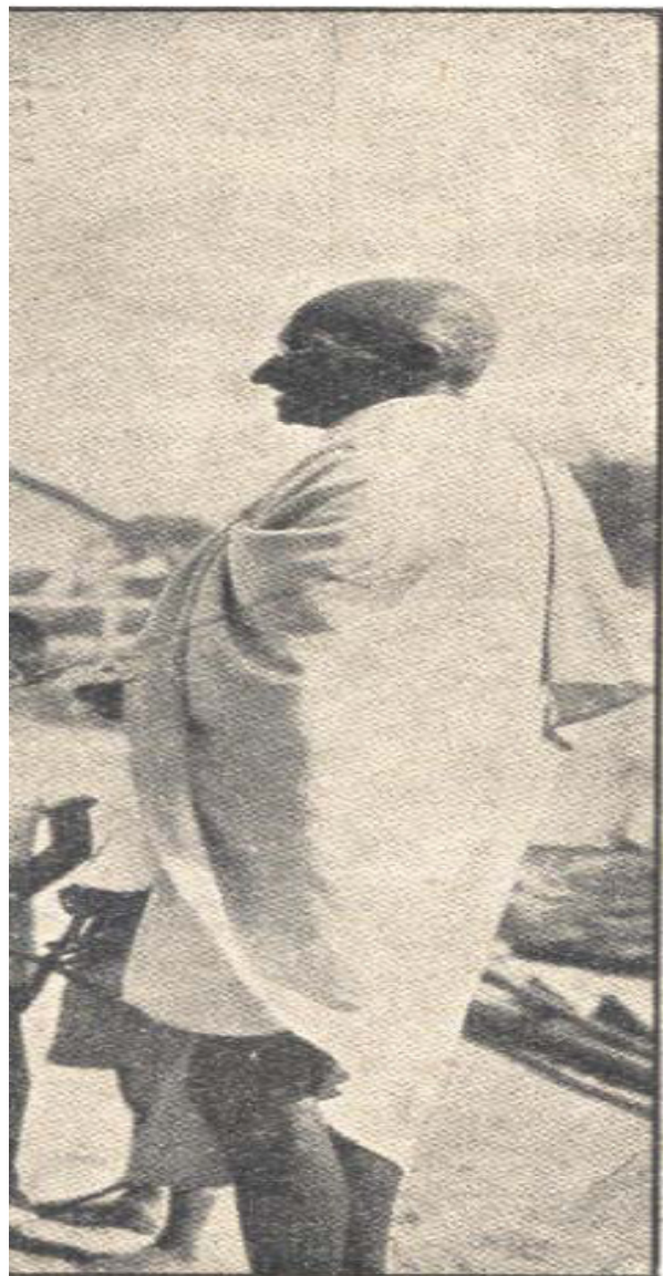
á Ghándí.

Největší a základní předností Ymky je, že nemá dogmatiku, že její vývoj je živým mořem, do kterého se vlévají všechny