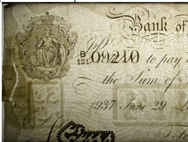
Detail vodoznaku na falešné librové bankovce

Němci začali padělat podstatně dříve, než vznikla operace Bernhard. Jednalo se o padělání sovětských červoňců a francouzských franků ve dvacátých letech minulého století. Padělanými francouzskými bankovkami se měly kromě jiného platit Francii reparace. Červoňce měly sloužit k oslabení sovětského hospodářství. Ve Frankfurtu nad Mohanem byly při jedné akci zadrženy 2 tuny padělaných bankovek v hodnotě dvou milionů rublů. I přes zatčení tří padělatelů tajná služba v padělání pokračovala. V roce 1927 bylo v Německu odhaleno velké padělání rublů. A pak jí předcházela tzv. operace Andreas.