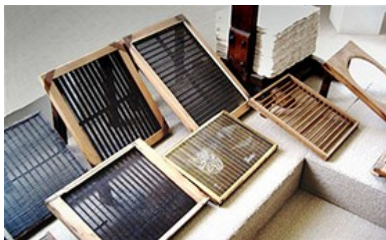
Obrázek papírenského síta.

Ruční papír se používá např. na luxusní obálky a dopisní papíry, přání atd. Je možné jej vyrábět v mnohem více variantách, tloušťkách, přimíchávají se do něj barevná vlákna apod. Vyrábí se na tzv. ručním sítu, kdy se nabere papírovina (směs papírových vláken, dalších příměsí a vody) a postupně, tzv. čerpáním, se voda odstraní. Na sítu zůstane vrstva zplstěných vláken – budoucí papír.