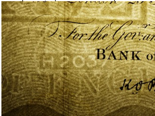
Detail falešné librové bankovky

U dolarů byl hlavním problémem, že jsou tištěny jinou tiskovou technikou než britské libry, konkrétně hlubotiskem. Příprava takové formy by byla velmi zdlouhavá. Krüger uznal, že rytí takových forem by bylo velmi pracné, a proto se rozhodl padělat dolary světlotiskem.