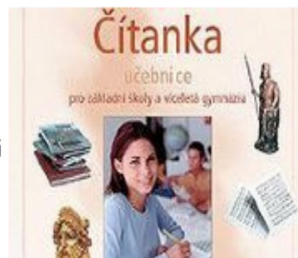
Obálka Čítanky 8 pro základní školy a víceletá gymnázia (nakladatelství Fraus)

V závěru dopisu vyzývá kardinál ministerstvo školství, aby přehodnotilo schválení zmíněné učebnice