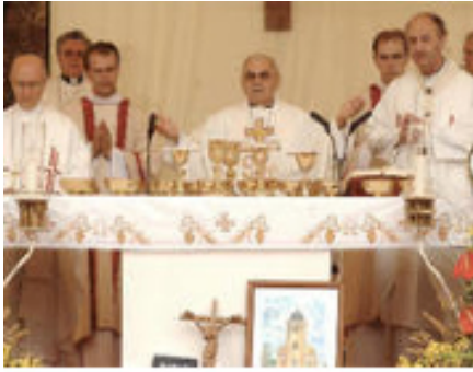
Kardinál Miloslav Vlk (uprostřed) a předseda České biskupské konference arcibiskup Jan Graubner (vpravo) celebrují mši ve Velehradě.